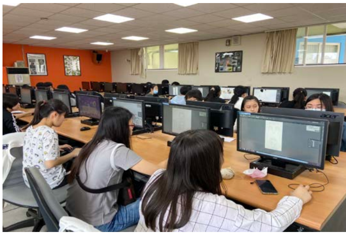
5/16 商品設計與製作介紹