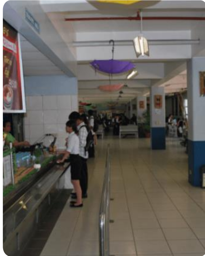
02 LPU Culinary Institute (由烹飪學院的學生製作餐點)