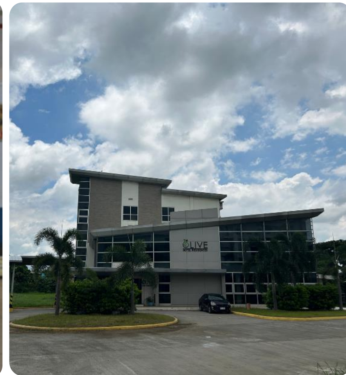
03 於校園內方便上課活動