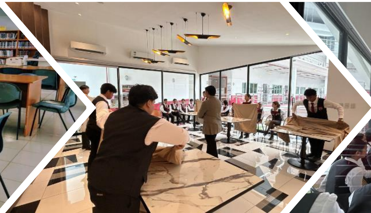
國際旅遊與酒店管理教室