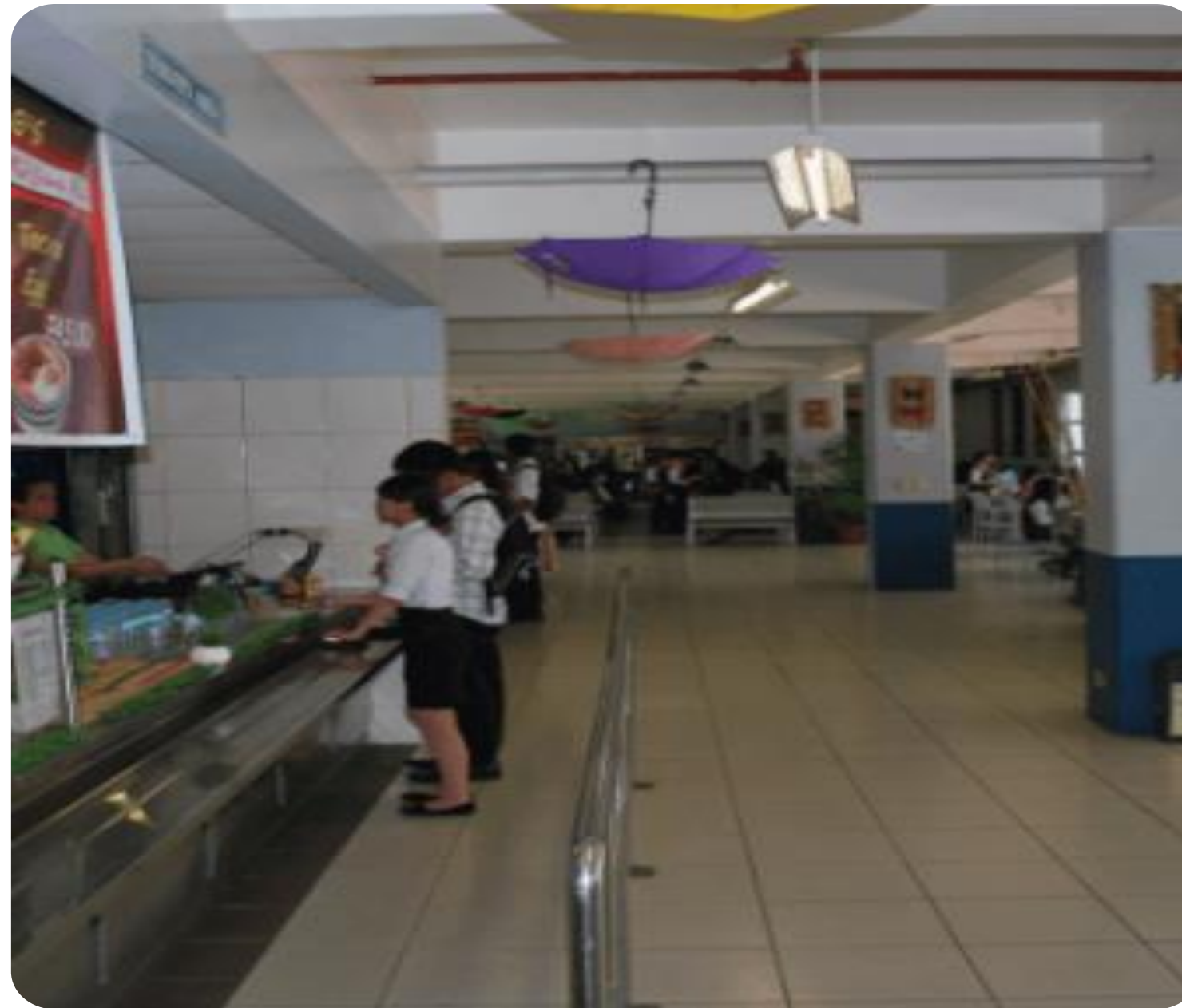
02 配有空調、Wifi 、24小時保安系統