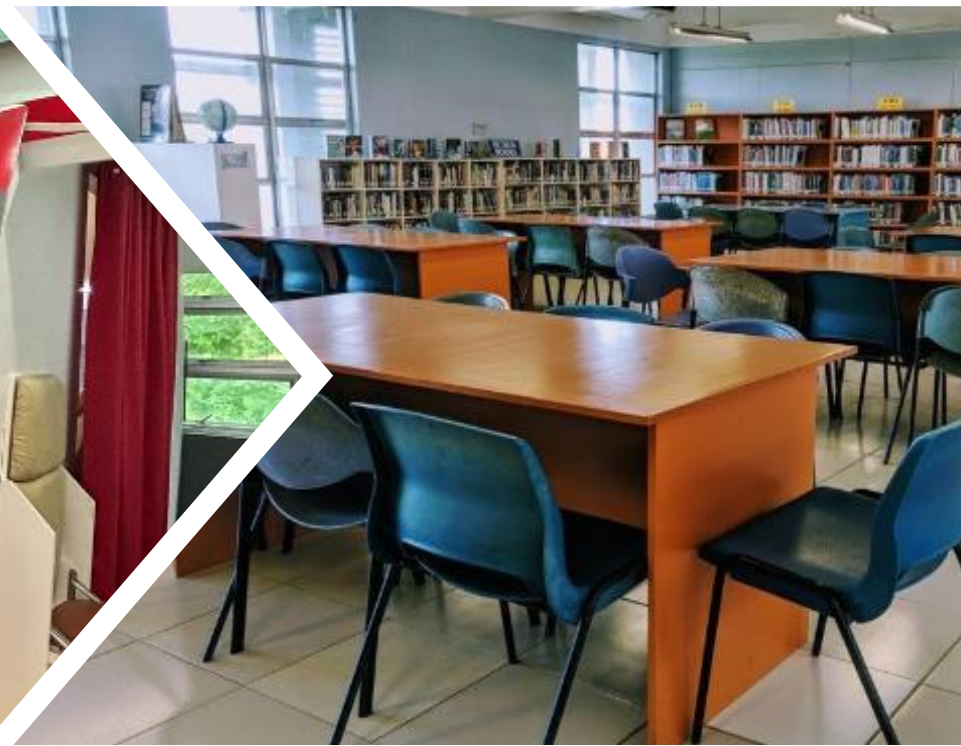
圖書館及校內書店