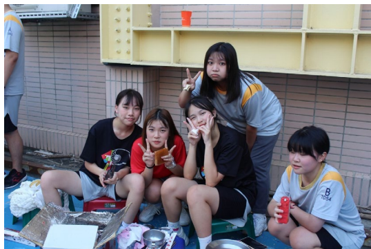
課程或活動/會議名稱：烤肉 日期/地點：113/6/21 愛河旁