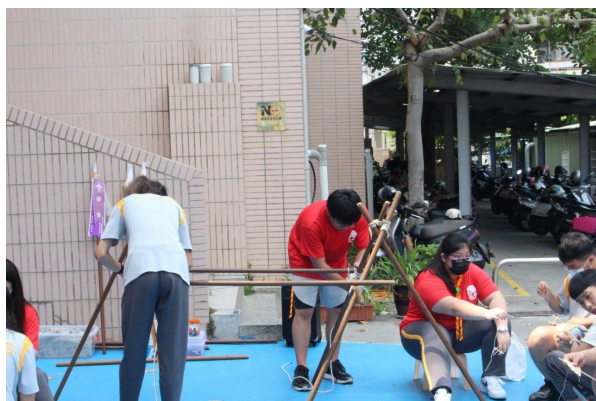
課程或活動/會議名稱：手工藝 日期/地點：113/5/03 愛河旁