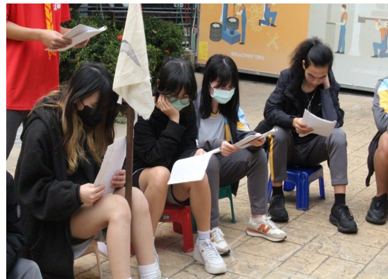
課程或活動/會議名稱：團康 日期/地點：113/3/15 愛河旁