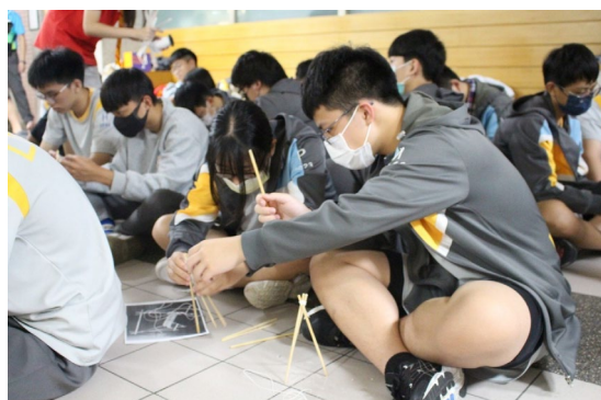
課程或活動/會議名稱：工程實作 日期/地點：113/4/26 雨備地點