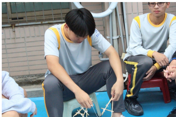
課程或活動/會議名稱：手工藝 日期/地點：113/5/03 愛河旁