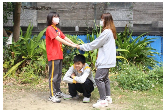
課程或活動/會議名稱：團康 日期/地點：113/3/15/草地