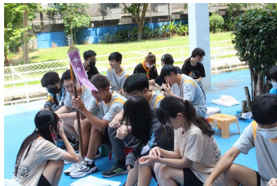
課程或活動/會議名稱：手工藝 日期/地點：113/5/03 愛河旁