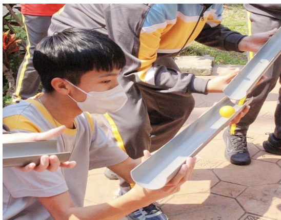
課程或活動/會議名稱：探索教育 日期/地點：113/3/08 愛河旁