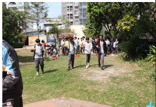
課程或活動/會議名稱：探索教育 日期/地點：113/3/08 愛河旁