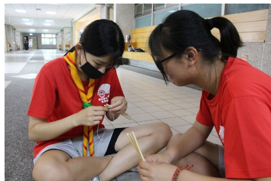
課程或活動/會議名稱：工程實作 日期/地點：113/4/26 雨備地點