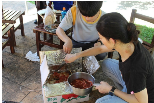
課程或活動/會議名稱：烤肉 日期/地點：113/6/21 愛河旁