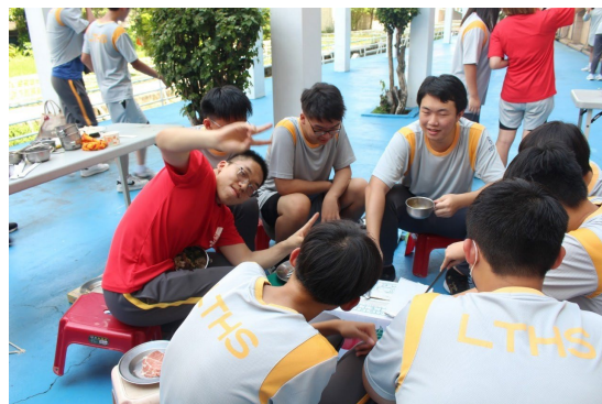
課程或活動/會議名稱：烤肉 日期/地點：113/6/21 愛河旁