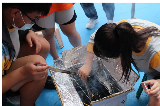
課程或活動/會議名稱：烤肉 日期/地點：113/6/21 愛河旁