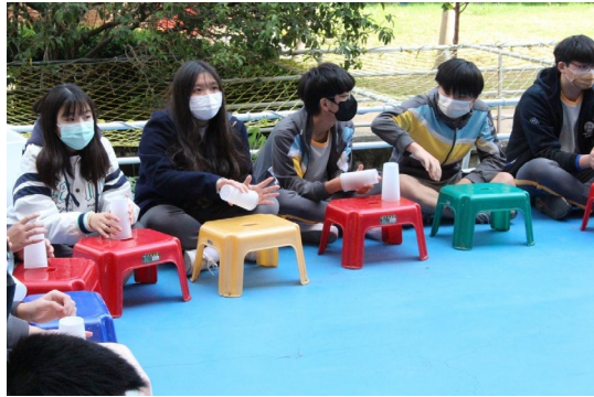
課程或活動/會議名稱：舞蹈 日期/地點：113 /6/14 愛河旁