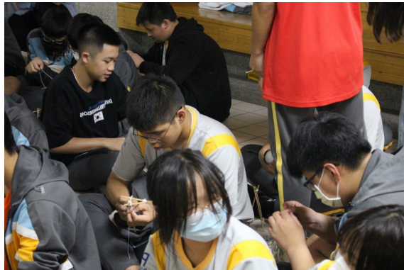
課程或活動/會議名稱：工程實作 日期/地點：113/4/26 雨備地點