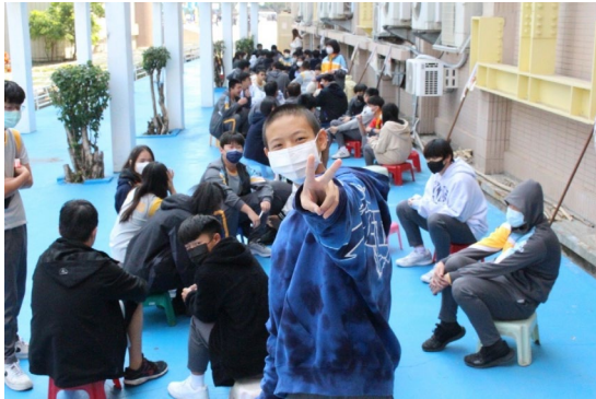
課程或活動/會議名稱：小隊時間 日期/地點：113/3/08 愛河旁