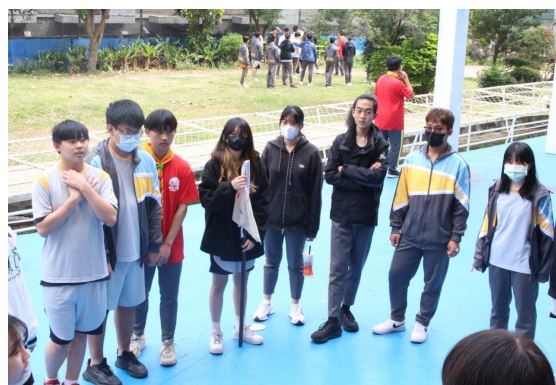
課程或活動/會議名稱：團康 日期/地點：113/3/15 愛河旁