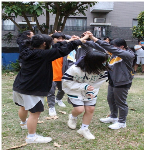
課程或活動/會議名稱：團康 日期/地點：113/3/15/草地