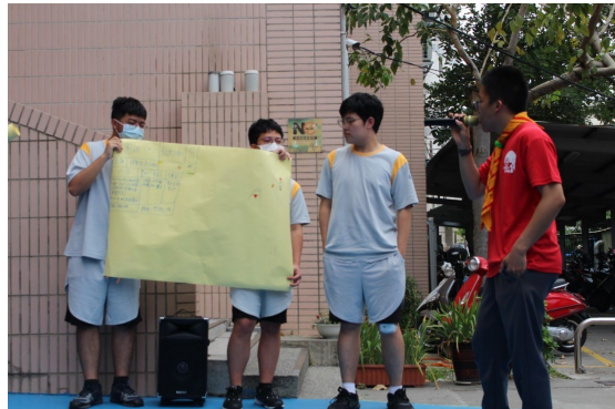
課程或活動/會議名稱：團集會設計 日期/地點：113/5/10 /愛河旁