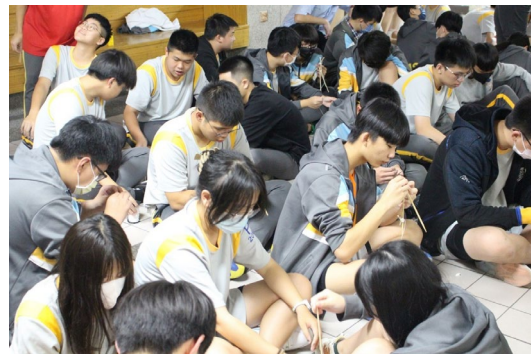
課程或活動/會議名稱：工程實作 日期/地點：113/4/26 雨備地點