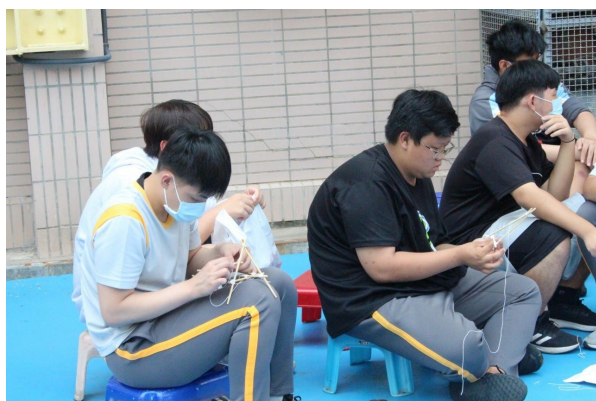
課程或活動/會議名稱：手工藝 日期/地點：113/5/03 愛河旁