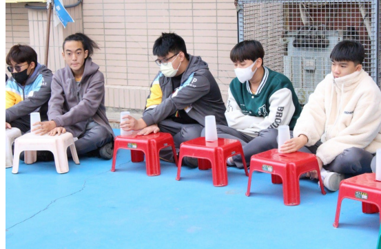
課程或活動/會議名稱：舞蹈 日期/地點：113 /6/14 愛河旁