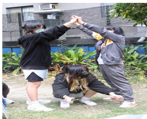
課程或活動/會議名稱：團康 日期/地點：113/3/15/草地