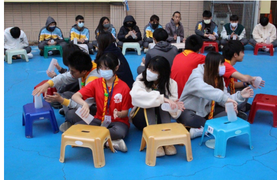
課程或活動/會議名稱：舞蹈 日期/地點：113 /6/14 愛河旁