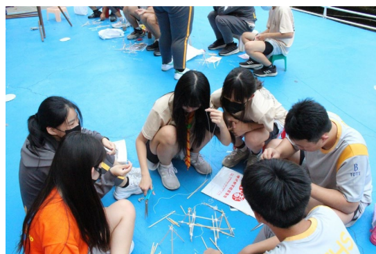
課程或活動/會議名稱：手工藝 日期/地點：113/5/03 愛河旁