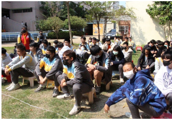
課程或活動/會議名稱：探索教育 日期/地點：113/3/08 愛河旁