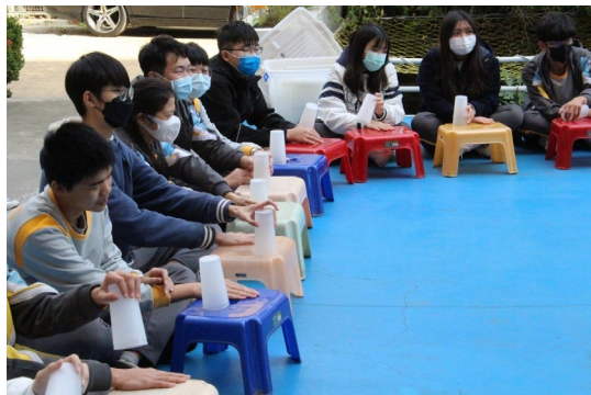
課程或活動/會議名稱：舞蹈 日期/地點：113 /6/14 愛河旁