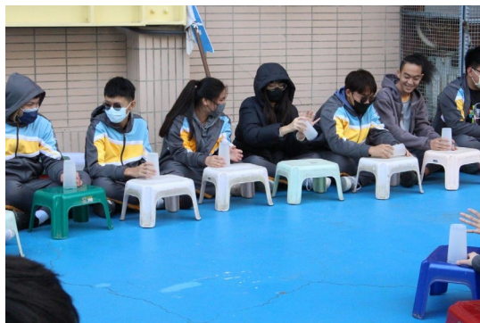
課程或活動/會議名稱：舞蹈 日期/地點：113 /6/14 愛河旁