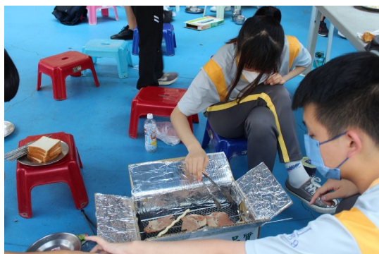
課程或活動/會議名稱：烤肉 日期/地點：113/6/21 愛河旁