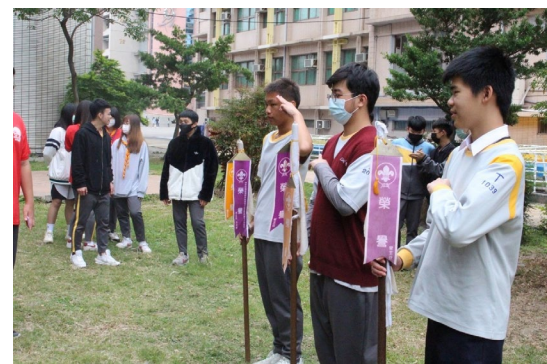
課程或活動/會議名稱：高團講評 日期/地點：113/3/15/草地