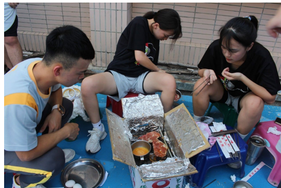
課程或活動/會議名稱：烤肉 日期/地點：113/6/21 愛河旁