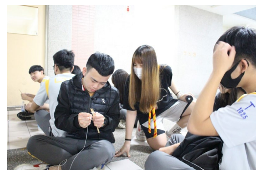
課程或活動/會議名稱：工程實作 日期/地點：113/4/26 雨備地點