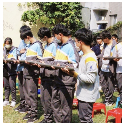
課程或活動/會議名稱：探索教育 日期/地點：113/3/08 愛河旁