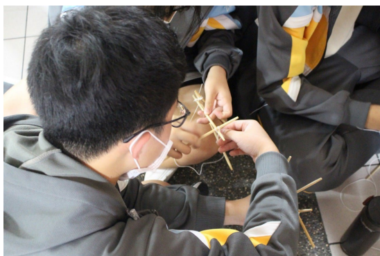
課程或活動/會議名稱：工程實作 日期/地點：113/4/26 雨備地點