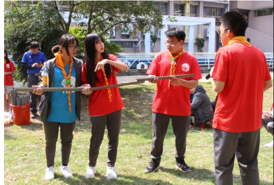
課程或活動/會議名稱：探索教育 日期/地點：113/3/08 愛河旁