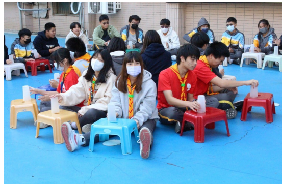
課程或活動/會議名稱：舞蹈 日期/地點：113 /6/14 愛河旁