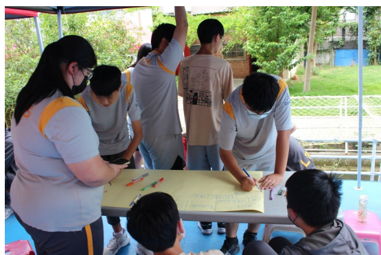
課程或活動/會議名稱：團集會設計 日期/地點：113/5/10 /愛河旁